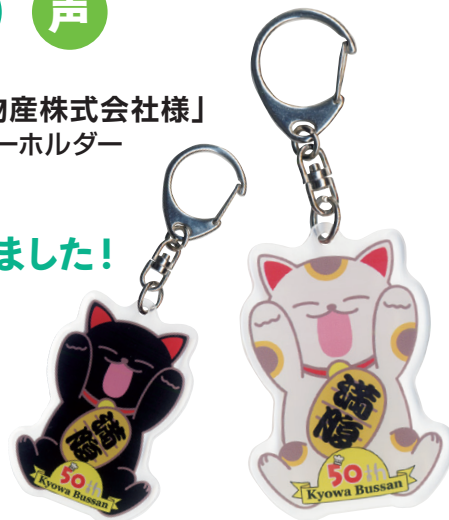
▲実際に納品した招き猫2種

協和物産様からもナイスアイデアということでGOをいただき、製作を開始しました。そしていざ納品というタイミングでシーティーイーより連絡が入り、「50周年サプライズのために、2〜3個黒猫バージョンも作りたい」という要望が。社長さんが昔黒猫を飼っておられたということからのサプライズ企画。まさにワンチーム、藤勝だからできることということで、実現しました。